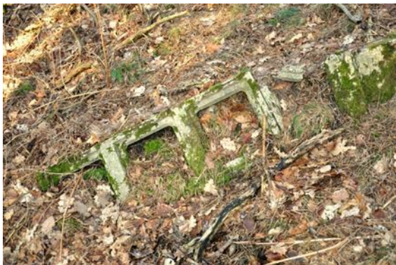
Figuur 3 Resten van de wanden van raattoren in het Spelderholt