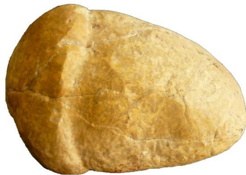
Figuur 5 Eikelvormige steen gevonden bij het Herenhul

De vondst werd in Leiden onderzocht op bewerkings- en gebruikssporen. Helaas was ze te veel afgesleten, zodat niet vastgesteld kon worden of het een bewerkte, of natuurlijk gevormde steen betrof.