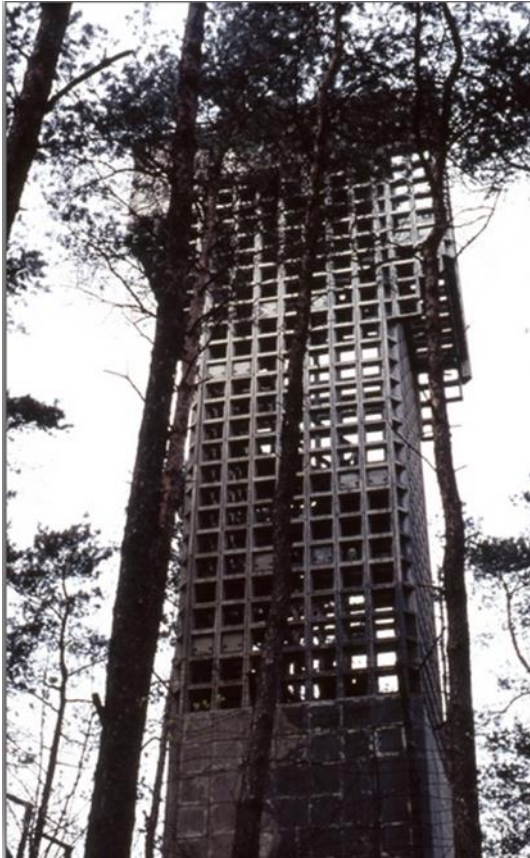
Figuur 2 Luchtwachtoren in het Spelderholt (Afbeelding CODA GA-021458)