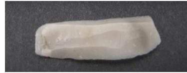
Figuur 4. Microliet gevonden in Meerveld.

Op meerdere plaatsen werden resten van vuursteenbewerking gevonden. Het meeste betrof afslagen. Een leuke vondst was een microliet (25 mm).