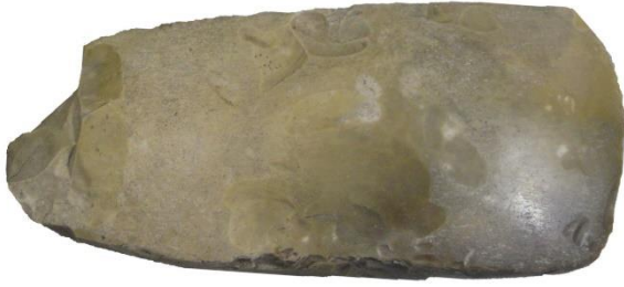
Figuur 6. Stenen bijlvan onbekende herkomst.