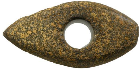
Afb. 5. Stenen hamerbijl.

De bijl heeft overigens een nieuwe bestemming gevonden: hij wordt door de eigenaar gebruikt om de biefstuk te pletten.