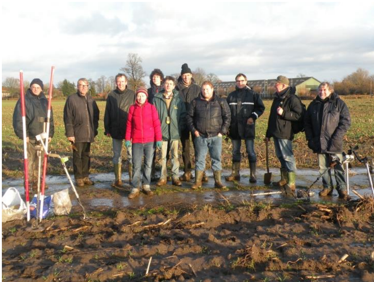
Afb. 7. Veldkartering Empe.

Het vorig jaar gestarte Hamaland project loopt nog steeds door. In januari werd door een grote groep AWN-ers een akker aan de Breetstraat in Empe onderzocht. Het weer zat helaas tegen en de oudste vondsten dateerden uit de 14 e eeuw.