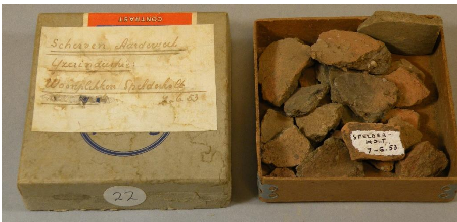
Afb. 3. Vondstdoosje van Moerman met vondsten uit het Spelderholt.

Het project loopt nog, maar het lijkt er op dat de vondsten wat vroeger zijn dan tot nu toe werd aangenomen. Meestal werd voor de bewoning in het Spelderholt 900 tot 1200 aangehouden. Op basis van de vondsten tot nu toe lijkt ze echter eerder te beginnen, en ook eerder op te houden (850 - 1050). Een meer precies datering van het aardewerk moet echter nog volgen.