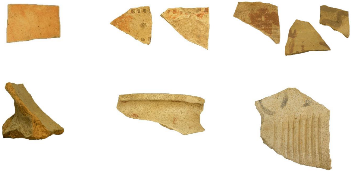
Afb. 2. Import aardewerk: Boven Badorf, Hunneschans en Pingsdorf. Onder een standlob, rand en oor van Pingsdorf aardewerk.

Een tweede perceel, rond het 'Jan Huigengat', leverde een soortgelijk beeld. Hier zijn echter minder boomvallen en de oogst is wat kariger. Tot nu toe werden ongeveer 75 kogelpot-, Pingsdorf- en Badorfscherven verzameld in een tiental boomvallen. Enkele honderden meters verder werden bovendien oudere scherven gevonden. Al in 2010, en nu opnieuw, werden daar scherven uit de 2 e en 3 e eeuw verzameld.