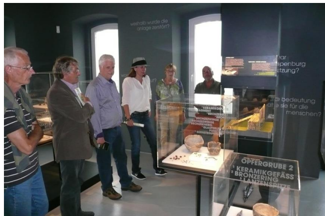
Afb. 8. Schnippenburgmuseum.

Het museum Schnippenburg in Schwagstorf Het museum exposeert prachtige vondsten, cultuurgoederen uit de meest noordelijke vindplaats van een Keltische omheinde nederzetting, een cultusplaats uit de Late IJzertijd.