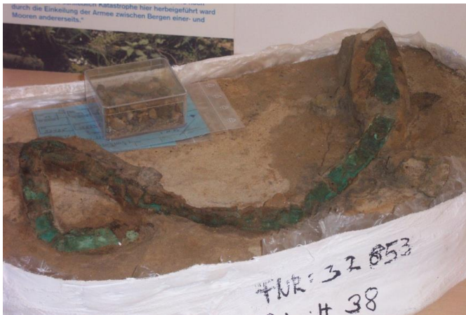
Afb. 6. Verbognen zwaard in de restauratieafdeling

Het park omvat een goed ingericht museum van vondsten en wetenswaardigheden van de slag en het slagveld. In de buitenlucht bevindt zich in het museumpark de route die de Romeinse legioenen zouden hebben genomen. Langs de route is op de ondergrondse resten een reconstructie gemaakt van de Germaanse wal die in de veldslag een rol speelde.