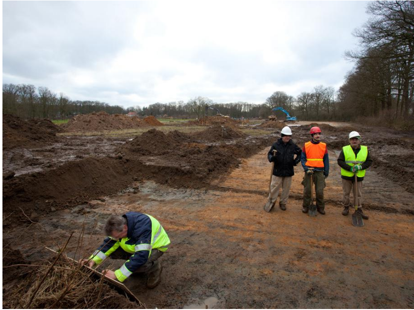
Afb. 9. Proefsleuvenonderzoek huize De Voorst