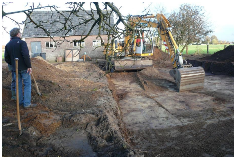
Afb. 2. Bouwput Gravenstraat

Op verzoek van de gemeente Voorst en regioarcheoloog Nathalie Vossen waren Huib de Kruijf en Herman Lubberding op 6 november aanwezig bij het graven van de bouwputten voor een woning en een loods aan de Gravenstraat. De locatie lag in de periferie van een gebied met een hoge verwachtingswaarde, maar bij de graafwerkzaamheden werd duidelijk dat de grens van het mogelijk archeologisch interessante gebied verder