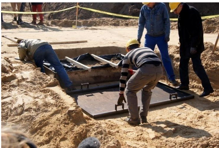
Afb. 4. Het lichten van het lijksilhouet.