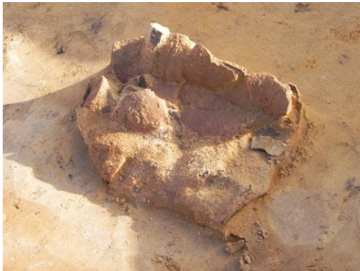
Afb. 2. Aardewerken beker.

Binnen een zeer grote ronde greppel werd een inhumatiegraf uit die veel oudere periode gevonden. Het lijksilhouet is uitzonderlijk goed bewaard gebleven. De dode, waarschijnlijk een man, is in hurkhouding begraven en ligt op de linkerzij. De bijgiften bestonden uit een versierde aardewerken beker, een geslepen stenen bijl en een vuurstenen mes. De vondst was zo bijzonder dat de gemeente Voorst heeft besloten om het geheel door het gespecialiseerde bedrijf Restaura uit Haelen te laten lichten en conserveren. Te zijner tijd zal het worden tentoongesteld.