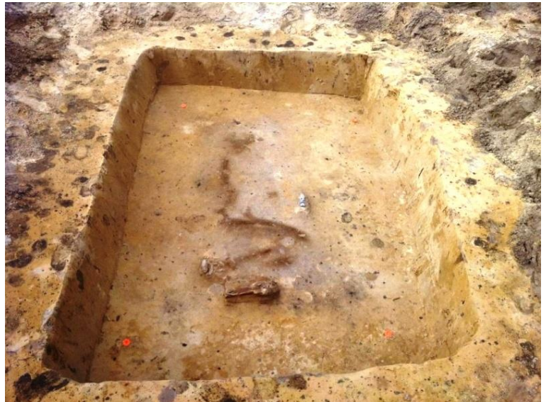
Afb. 3. Lijksilhouet.