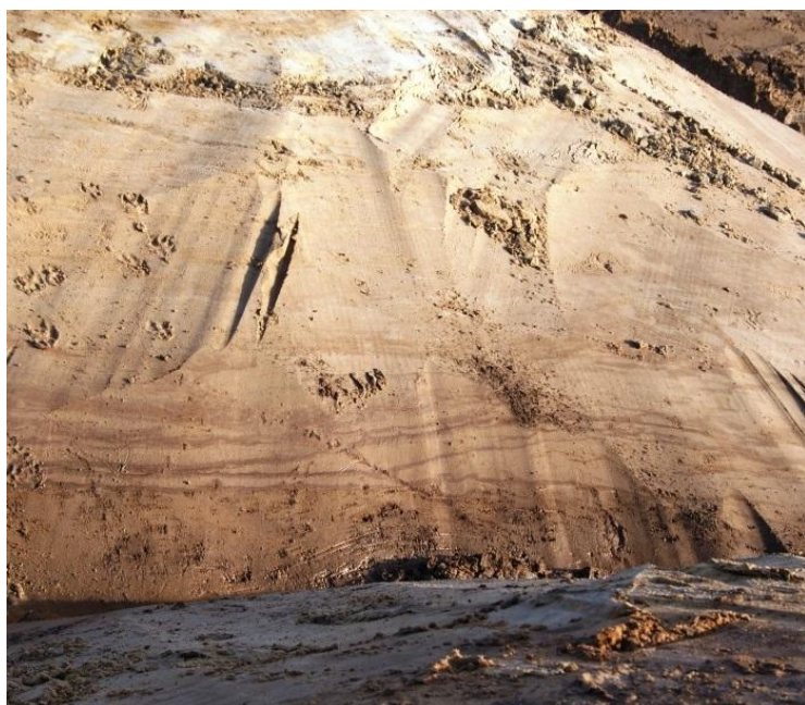
Afb. 3. Dunne humusbandjes in de opgestoven laag.

Aan de Breestraat werd een weiland tot natuurgebied verheven. De weidegrond werd gefreesd en er werd een vijverpartij gegraven. Beide bovengenoemde AWN-ers begeleidden op 3 december het graafwerk, op verzoek van de gemeente Voorst. Ook hier lag op een voorheen drassig terrein een zeer dunne akkerlaag boven heidepodsol, rustend op dekzand. Doordat de bodem plaatselijk tot meer dan drie meter werd ontgraven kregen we een goed beeld van de bodemopbouw.